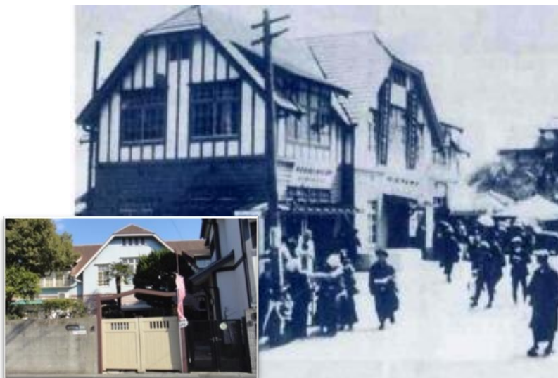
カフェーパウリスタ甲陽園店の今昔

カフェーパウリスタと甲陽園店についてのお話を展示品を見ながらお楽しみいただけます。