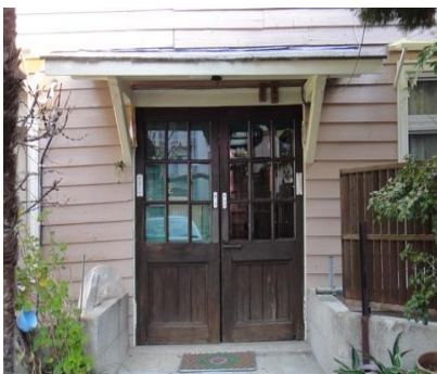
当時まで珍しい格調高い玄関扉