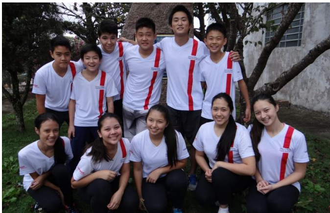
ブラジル・源流太鼓チーム

ブラジルを始めとする南米への移住者を送り出した「海外移住と文化の交流センター」で是非演奏し、皆様に聞いていただきたいとの趣旨で、開催が決まりました。