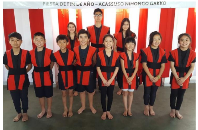
アルゼンチン・アカスーソ太鼓チーム