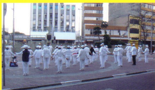
サンパウロの広場で毎朝行なわれるラジオ体操