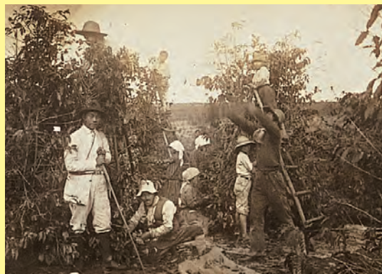
ブラジルのコーヒー農園で働く日本移民