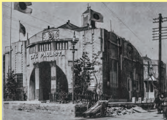
カフェパウリスタ三ノ宮喫店（1912年開店）