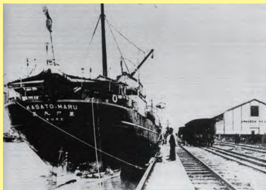
最初のブラジル移民船「笠戸丸」がサントス港に到着（1908年）

この企画展では「コーヒー」をテーマに、ブラジルと日本移民、そして神戸を中心にコーヒーが普及するまでの歴史を紹介します。