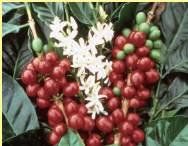
コーヒーの花と実