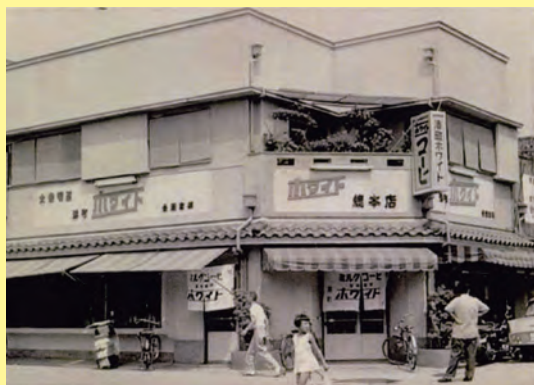
新開地の「湊町ホワイト」（1929年開店）